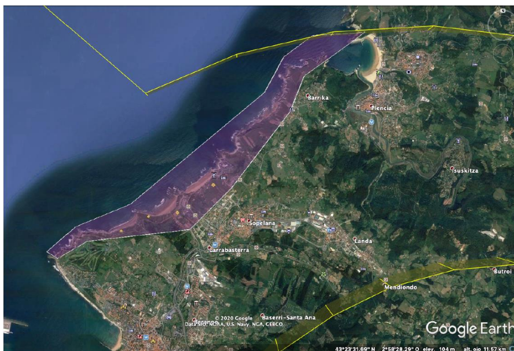
Imagen 1-Zona de operación de parapentes/alas delta en Uribe Kosta

Una de las zonas donde la Federación Vasca de Actividades Aéreas desarrolla actividades de parapente/ala delta, conforme a la normativa en vigor, es la zona de Uribe Kosta, ubicada a más de 10 km al norte del ARP del aeropuerto de Bilbao, dentro de CTR BILBAO, espacio aéreo controlado por ENAIRe, proveedor de servicios de tránsito aéreo del aeropuerto de Bilbao (en adelante LEBB).