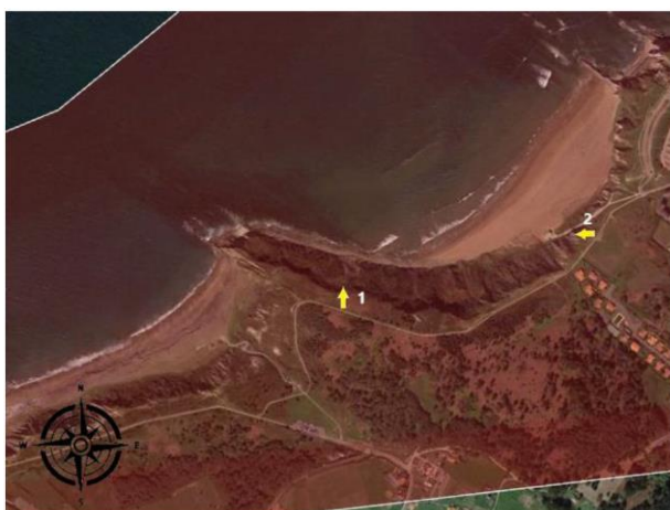
Imagen 2-Ubicación de las zonas habituales de despegue y aterrizaje de parapentes/alas delta